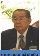
ท่านพนอม เข้าวัด

“ในความเป็นจริงของการทำประโยชน์ต่อสังคม ไม่ควรแบ่งแยกชายหญิง ดังนั้น ควรเปิดโอกาสให้นักเรียนชายร่วมมือกัน ยุวกาชาดชายควรทำผสมผสานกับนักเรียนหญิง ประกอบกับได้ทำการทดลองกับกลุ่มนาร่องแล้วเกิดผลดี”